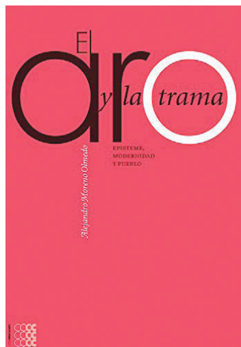
Alejandro Moreno Olmedo. El aro y la trama . Episteme, Modernidad y Pueblo, 2009.

es la relación que le da forma y contenido entre pensar y sentir en la experiencia de la concreta relación entre el opresor y los oprimidos. Pero no es superación extremadamente teórica del odio, sino tal comprensión teórica por lo vivido en el presidio lo anima políticamente, le da el terreno para la otra práctica, integrada también como pensar, para lograr la liberación, es decir, una complementariedad que evoca la relación de los sentimientos con la actividad militante liberadora a partir de la concientización surgida en las llagas.