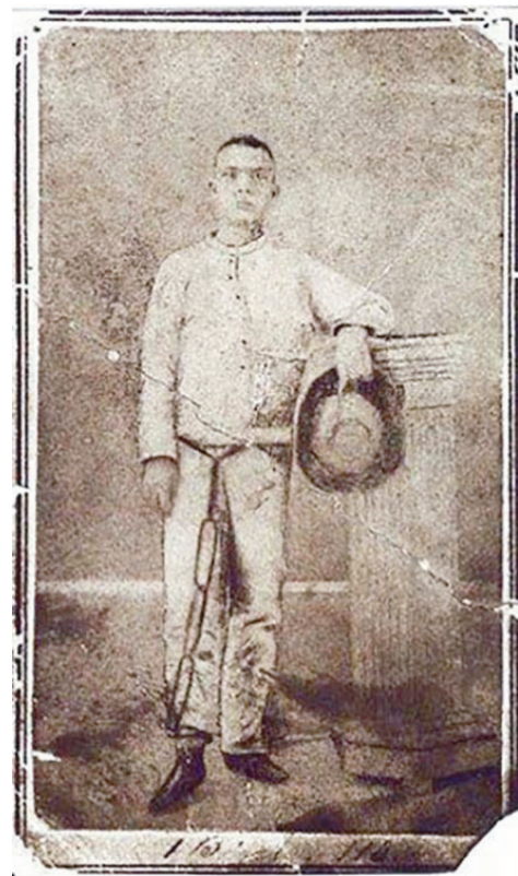
Martí en presidio, 28 de agosto de 1870.

(OC, I: 69). Toma para sí desde la relación vivida, piensa en relación con todas las posibilidades humanas delante de situación semejante y asevera: “Presidio, Dios: ideas para mí tan cercanas como el inmenso sufrimiento y el eterno bien. Sufrir es quizás gozar. Sufrir es morir para la torpe vida por nosotros creada, y nacer para la vida de lo bueno, única vida verdadera” (OC, I: 54), dejándonos siempre la alternativa que flota en su episteme de relación sin pretensiones de supresión, antes de prevención y de juntura, de unidad de lo diverso, en las venturas y desventuras de la vida.